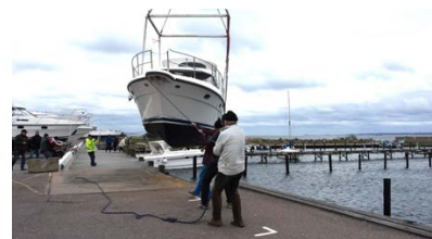
Det blev en blåsig sjösättning under fredagen.