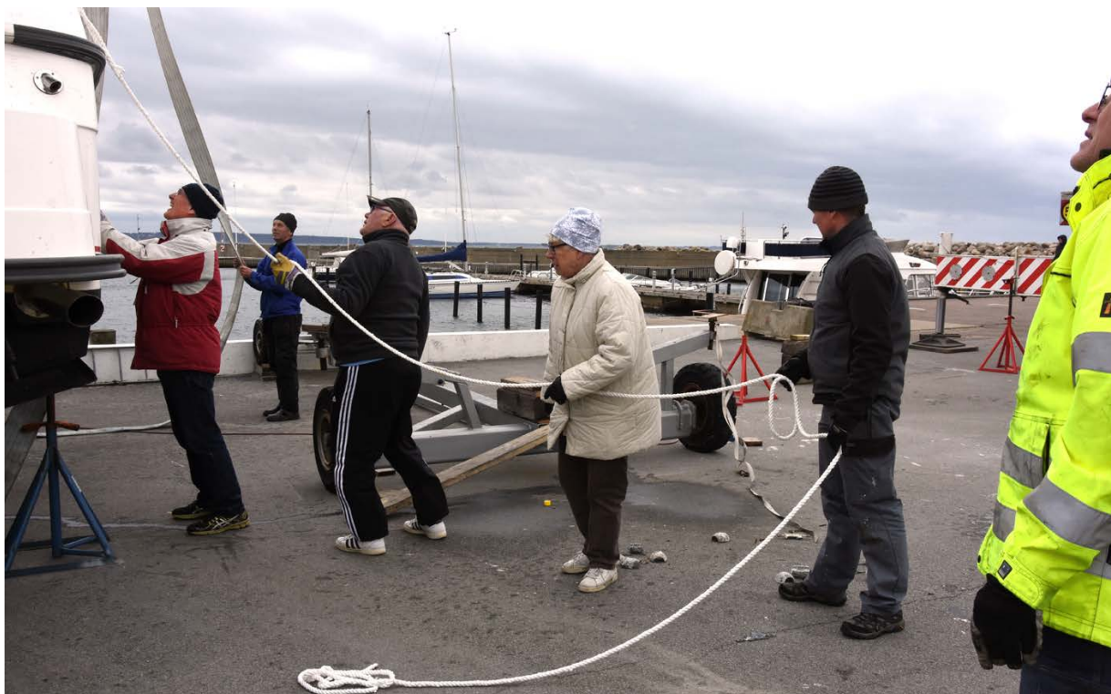
Många får hjälpas åt när vinden tar i.